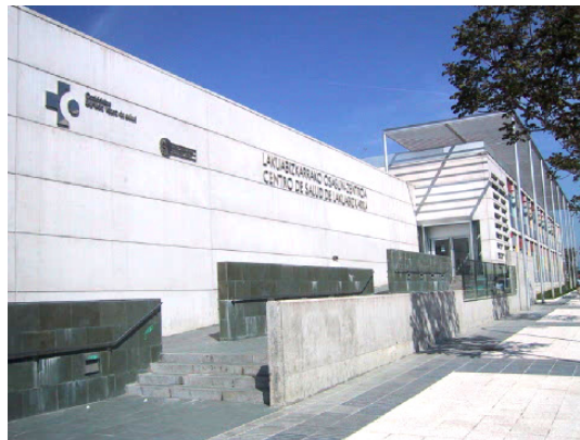
CSM de Lakuabizkarra

Los problemas derivados del uso del alcohol y otras drogas, las ludopatías y los problemas de salud mental de los niños y adolescentes son atendidos en otros centros específicos.