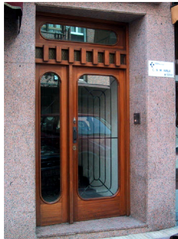
Entrada del edificio donde está situado el CSM de Aiala - Llodio

Además, atiende problemas derivados del uso del alcohol y problemas de salud mental de los niños y adolescentes.