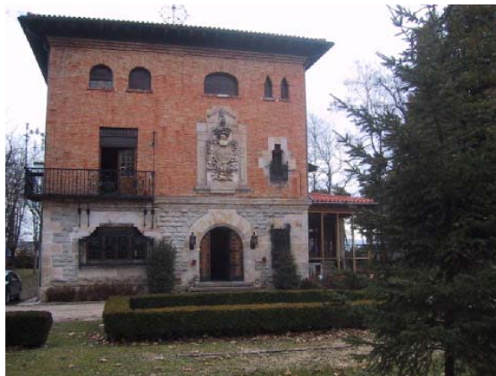
Palacio del Marqués de Foronda

Los servicios se prestan desde una Unidad residencial especializada en el tratamiento integral, intensivo, coordinado en sus diferentes procesos e integrado dentro de la continuidad de cuidados prestada por Osakidetza / Servicio vasco de salud, y el Hospital Psiquiátrico y Salud Mental Extrahospitalaria a los pacientes señalados con anterioridad.