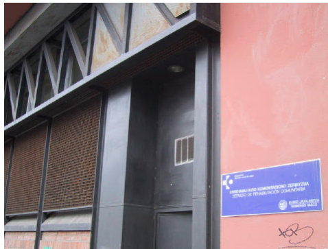
Servicio de Rehabilitación Comunitaria

El Servicio de Rehabilitación Comunitaria es un espacio mixto de tratamiento especializado en programas de rehabilitación psicosocial, que depende funcionalmente del Hospital Psiquiátrico de Álava y que está ubicado en la comunidad.